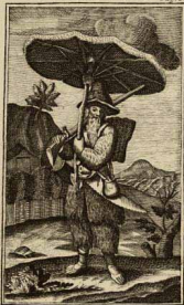
Робинзонъ у офянтю.